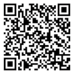
新鉅鑫贏家 外幣變額萬能壽險