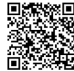
新鉅鑫贏家 變額年金保險